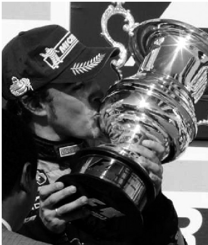
Vítězná trofej v rukou Fernanda Alonsa

Letos proběhlo v F1 několik změn. Přibýly stáje Toro Rosso, Super Aguri a ruský Midland. Napak z kalendáře šampionátu zmizela Velká cena Belgie, z McLarenu odešel jeden z předních pilotů Juan Pablo Montoya. Jedním z největších překvapení letošní sezony je Felipe Massa. Letos poprvé se představil v barvách Ferrari